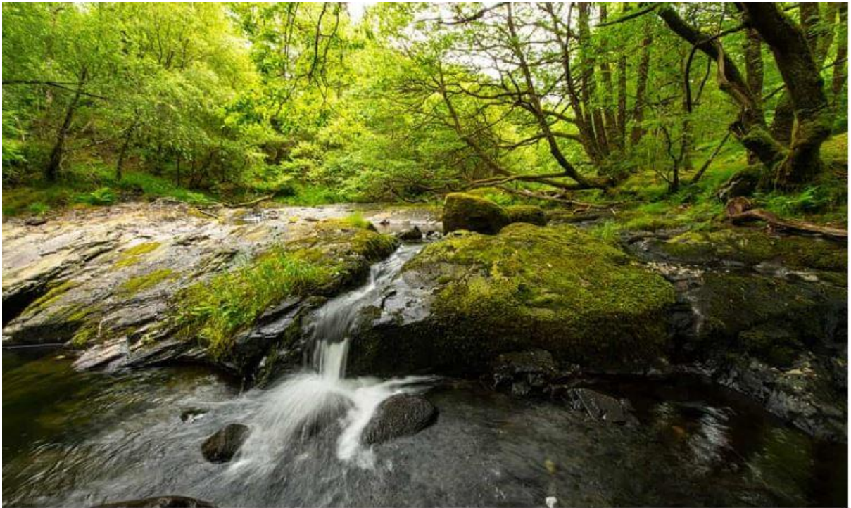
▲ The Celtic rainforest in Wales.